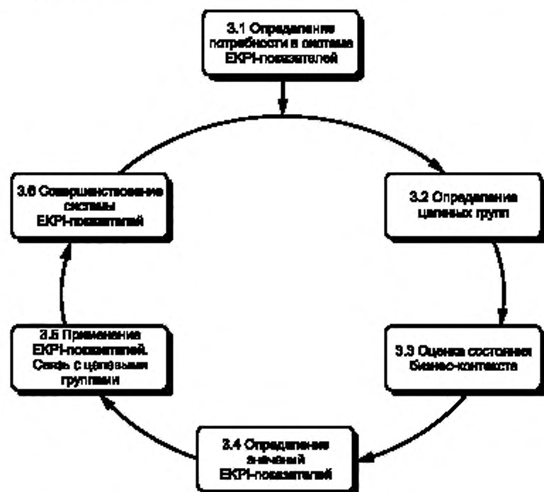
Рисунок 1 — Полный цикл работ, связанных с предварительной оценкой, разработкой, практическим применением и непрерывным совершенствованием системы ЕКРІ-показателей предприятия

Решение о разработке и практической реализации системы ключевых показателей экологической эффективности должно приниматься высшим руководством предприятия. Работа должна начинаться с анализа совокупных затрат и выгод. Анализ должен проводиться с максимально возможной точностью, а его результаты должны отражать не только затраты, но и предполагаемые выгоды. Практическая реализация системы ЕКРІ-показателей является независимым проектом. На этом этапе предприятие проверяет возможность интеграции разрабатываемой системы ЕКРІ-показателей в свою систему экологического менеджмента.