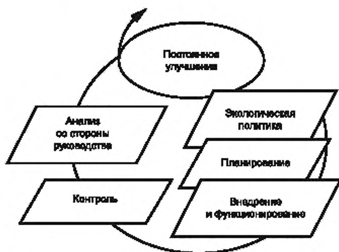
Рисунок А.1 — Модель системы экологического менеджмента — петля качества мероприятий по постоянному улучшению