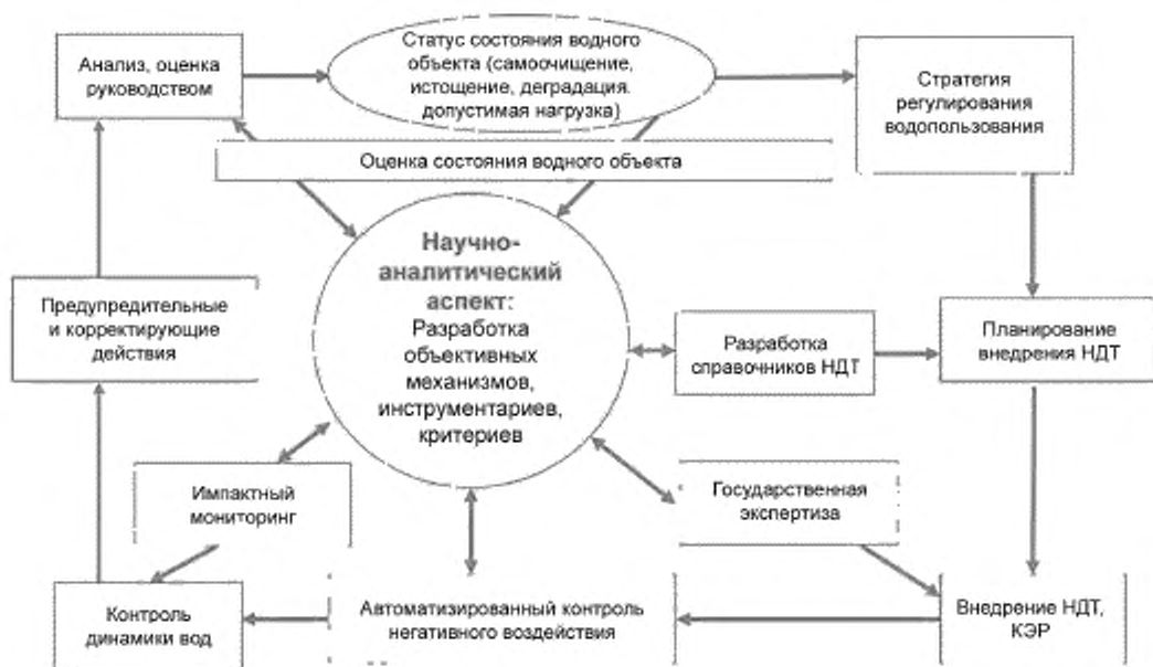
Рисунок Д.1 — Петля качества государственной функции регулирования водопользования

Петля качества регулятивной функции включает обязательную процедуру — научно-аналитическое сопровождение регулирования водопользования, акцентирование которого объясняется следующими основными причинами: