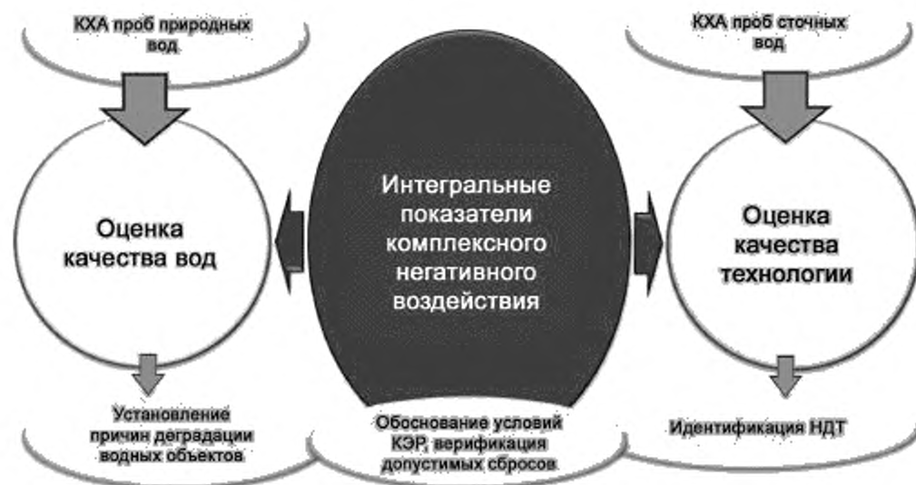
Рисунок Г.1 — Унификация экологического научно-аналитического сопровождения технологического регулирования водопользования