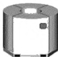
а) Бухта с вертикальной осью вращения

9.1 Для обеспечения целостности каждая бухта катанки должна быть плотно перевязана не менее чем в трех местах отрезками катанки или упаковочной лентой способом, исключающим рассыпание или перекося бухт при транспортировании, и отгружаться потребителю, например, на деревянных поддонах, предохраняющих катанку от механических повреждений при транспортировании. Бухту на поддоне располагают двумя способами, которые определяются положением ее оси вращения (рисунок 3). Требование к расположению оси бухты, являющееся обязательным к исполнению, указывают в соглашениях на поставку между потребителем и изготовителем