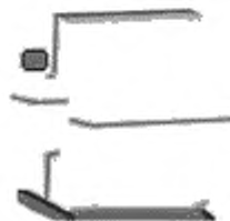
б) Бухта с горизонтальной осью вращения