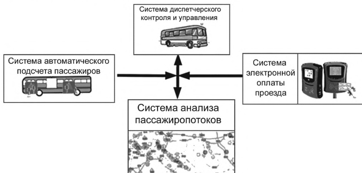
Рисунок 1 — Схема взаимодействия САП с источниками данных

Помимо данных от СПП в САП используется информация из АСДУ и АСОП. Синтез данных от указанных систем позволяет определить параметры пассажиропотоков и оценку качества перевозки пассажиров в различных «разрезах» и для различных уровней агрегации. Общая схема взаимодействия САП с источниками данных представлена на рисунке 1.