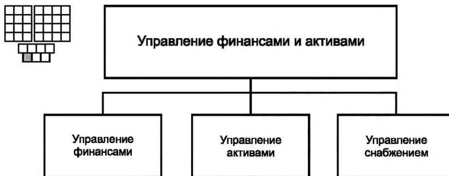
Рисунок 3 — Декомпозиция группы процессов «Управление финансами и активами» на элементы процессов уровня 2

6.1 Структура группы процессов «Управление финансами и активами» и соответствующие элементы процессов уровня 2 приведены на рисунке 3. На рисунке 3 представлена также пиктограмма, которая является общей для всех элементов процессов уровня 2.