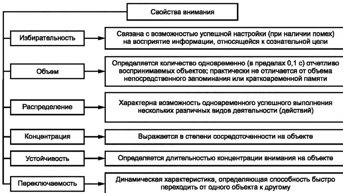
Рисунок 5 — Основные свойства внимания

6.7 Внимание специалиста при проведении деятельности по избирательному осмыслению информации обладает пятью основными свойствами: устойчивостью, сосредоточенностью, переключаемостью, распределением и объемом (см. рисунок 5).