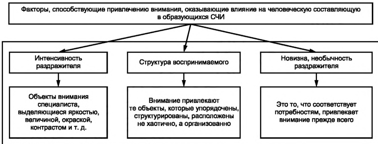
Рисунок 1 — Факторы, способствующие привлечению внимания

Третий фактор — структура воспринимаемого, когда внимание привлекают те объекты, которые упорядочены, структурированы, расположены не хаотично, а организованно.