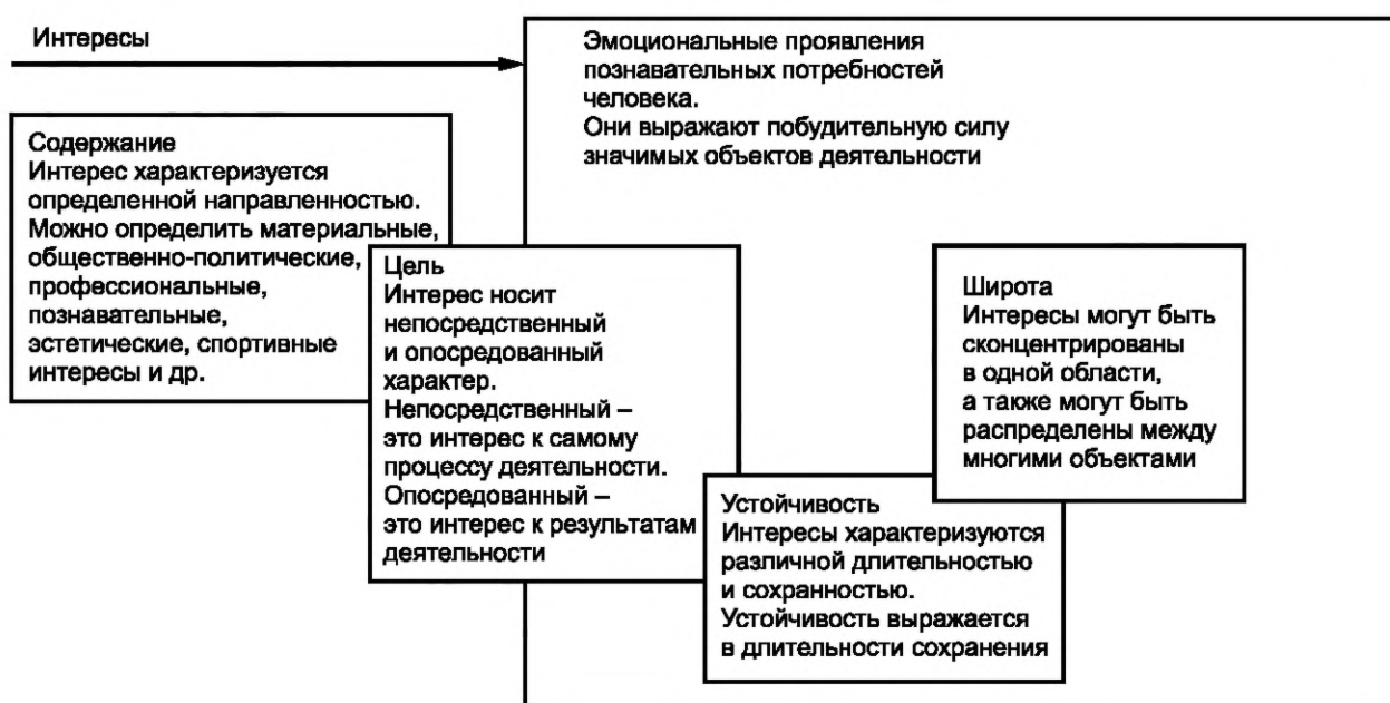
Рисунок 3 — Характеристика интереса как одного из видов мотивов

Интересы как один из видов мотивов различаются по содержанию, цели, широте и устойчивости (см. рисунок 3).