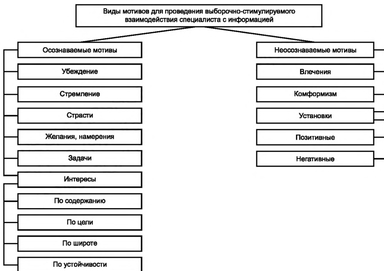
Рисунок 2 — Виды мотивов

Осознаваемые мотивы характеризуются тем, что специалист отдаёт себе отчет в том, что побуждает его к деятельности, что является содержанием его потребностей, определяющих цели, которые направляют деятельность специалиста на длительный период.