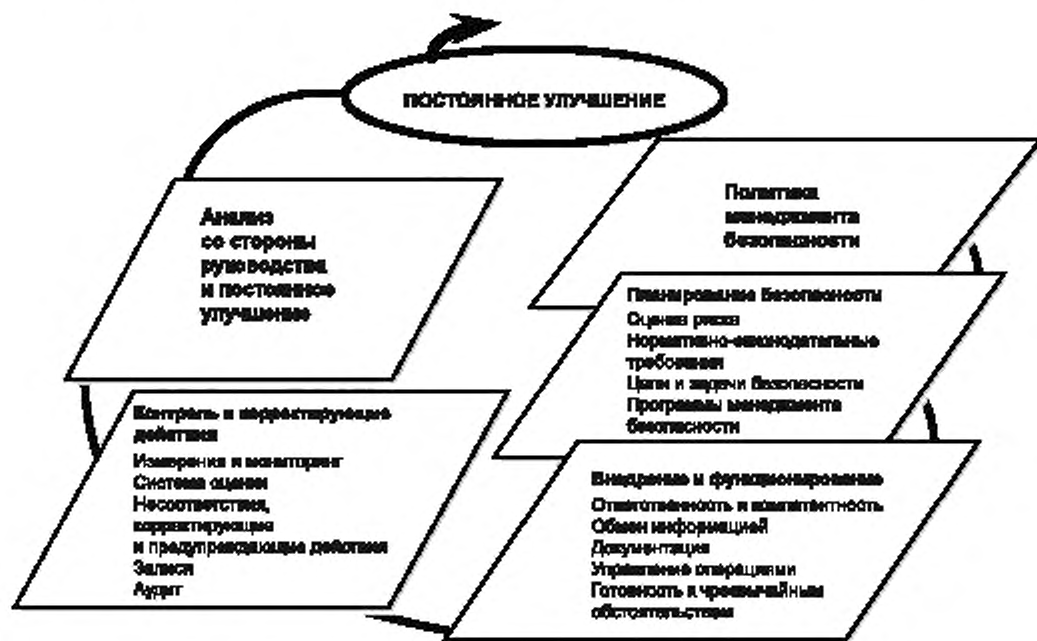
Рисунок 2 — Элементы системы менеджмента безопасности