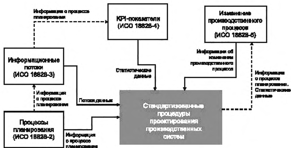
Рисунок 2 — Взаимосвязь между различными частями комплекса международных стандартов ISO 18828

В настоящем стандарте представлен обзор комплекса международных стандартов ISO 18828: