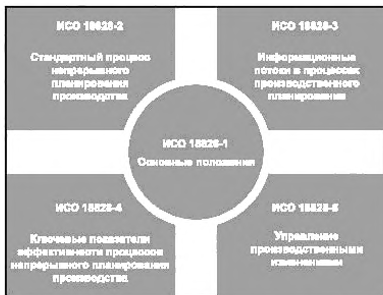
Рисунок 1 — Структура комплекса международных стандартов ИСО 18828

Комплекс международных стандартов ИСО 18828 определяет стандартизованные процедуры проектирования производственных систем. Основными выгодоприобретателями (бенефициарами) использования рассмотренных в настоящем стандарте принципов, относящихся к таким аспектам, как производственные процессы и изменения в них, информационные потоки и ключевые показатели эффективности (KPI), могут стать руководители и сотрудники планово-производственных отделов. Структура международных стандартов ИСО 18828 (на момент публикации настоящего стандарта) приведена на рисунке 1.