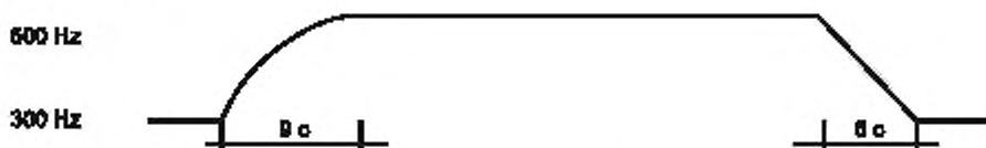
Рисунок 1 — Диаграмма однотонового режима звучания

- в режиме изменяющейся тональности в соответствии с рисунком 2.