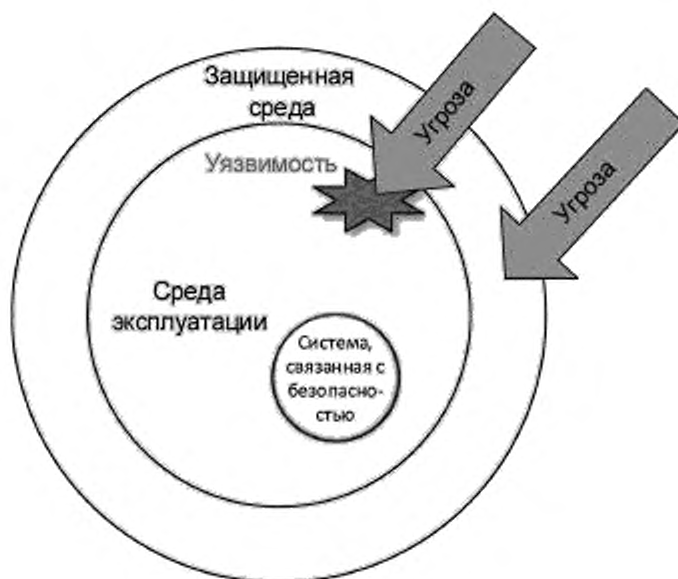
Рисунок 3 — Защищенная среда