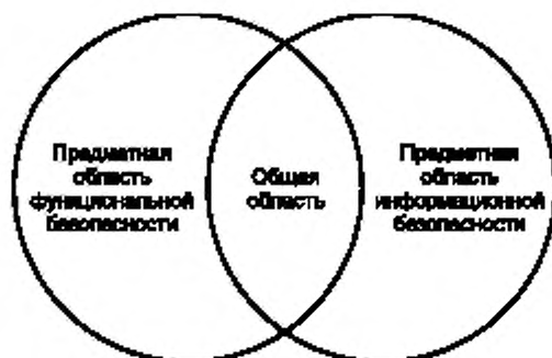
Рисунок 2 — Предметная область функциональной безопасности и предметная область информационной безопасности

Меры защиты информации в защищенной среде могут быть интегрированы в любой функциональный элемент технической системы, включая функциональный элемент системы, связанной с безопасностью.