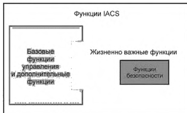
Рисунок 1 — Обзор функций IACS

В МЭК 61508 (все части) основное внимание уделяется реализации функций безопасности, а описания архитектуры в большей степени связаны с такими характеристиками, как отказоустойчивость аппаратных средств (HFT) и стойкость к систематическим отказам. Однако предварительно определенной архитектуры, общей для всех предполагаемых систем, не существует. Вместо этого в МЭК 61508 (все части) определяются критерии полноты безопасности, такие как уровень полноты безопасности (SIL) и стойкость к систематическим отказам (SC), что позволяет определить показатель уровня функциональной безопасности, специально разработанный для IACS, и соответствующие характеристики, достигающие достаточно низкой интенсивности случайных отказов, а также сформировать адекватный набор мер для снижения систематических отказов. В некоторых частях комплекса МЭК 62443 рассматривается структура системы IACS, состоящая из базовой системы управления технологическим процессом и приборной системы безопасности, а также описываются характеристики их установки для перерабатывающего производства. Однако окончательное описание архитектуры и его содержание предполагают некоторую реализацию, которая не обязательно удовлетворяет требованиям информационной безопасности или функциональной безопасности. На рисунке 1 представлен обзор функций IACS, включающий функции безопасности, жизненно важные функции, базовые функции управления и дополнительные функции IACS.