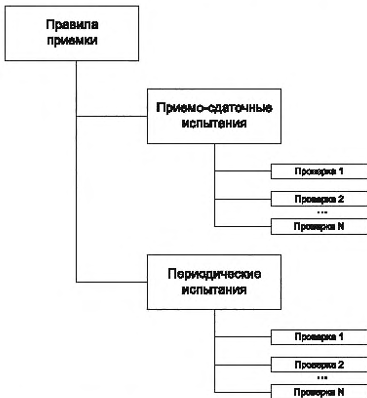
Рисунок 2 — Фрагмент структуры разделов ТУ «правила приемки» и «методы контроля (испытаний)»

Схематично фрагмент разделов ТУ «правила приемки» и «методы контроля (испытаний)» приведен на рисунке 2.