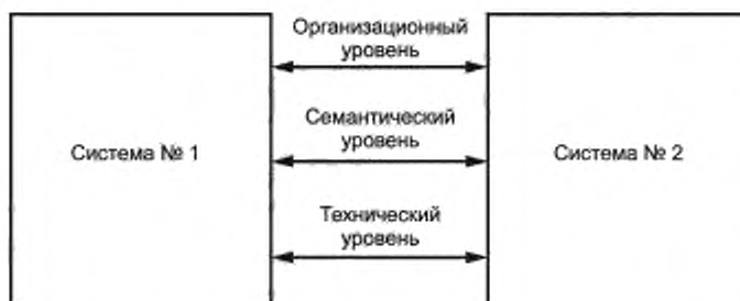
Рисунок 1 — Эталонная модель интероперабельности

Эталонная модель интероперабельности, приведенная на рисунке 1, представляет собой развитие семиуровневой базовой эталонной модели ВОС согласно ГОСТ Р ИСО/МЭК 7498-1, [3].