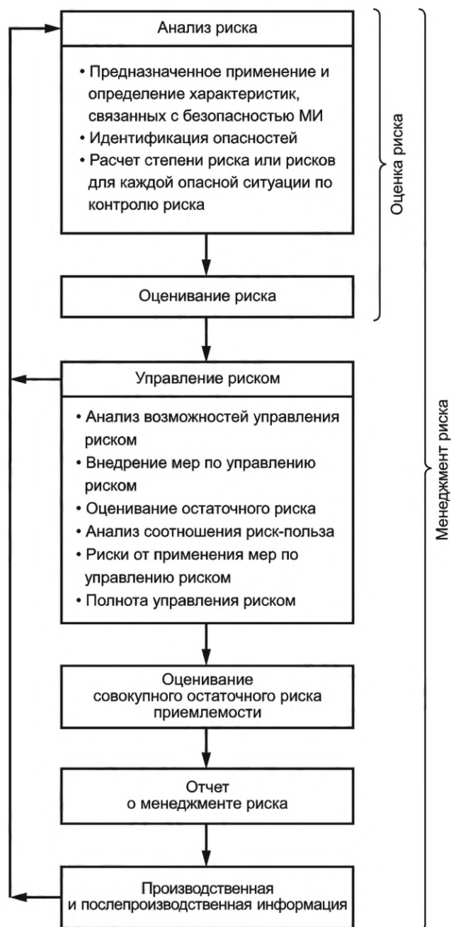
Рисунок В.1 — Схематическое представление процесса менеджмента риска (см. ISO 14971)