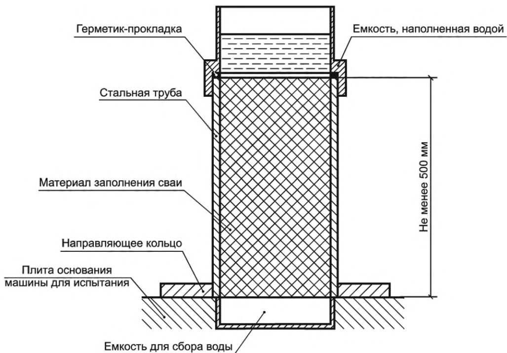
Рисунок А.1 — Схема проведения испытаний на герметичность