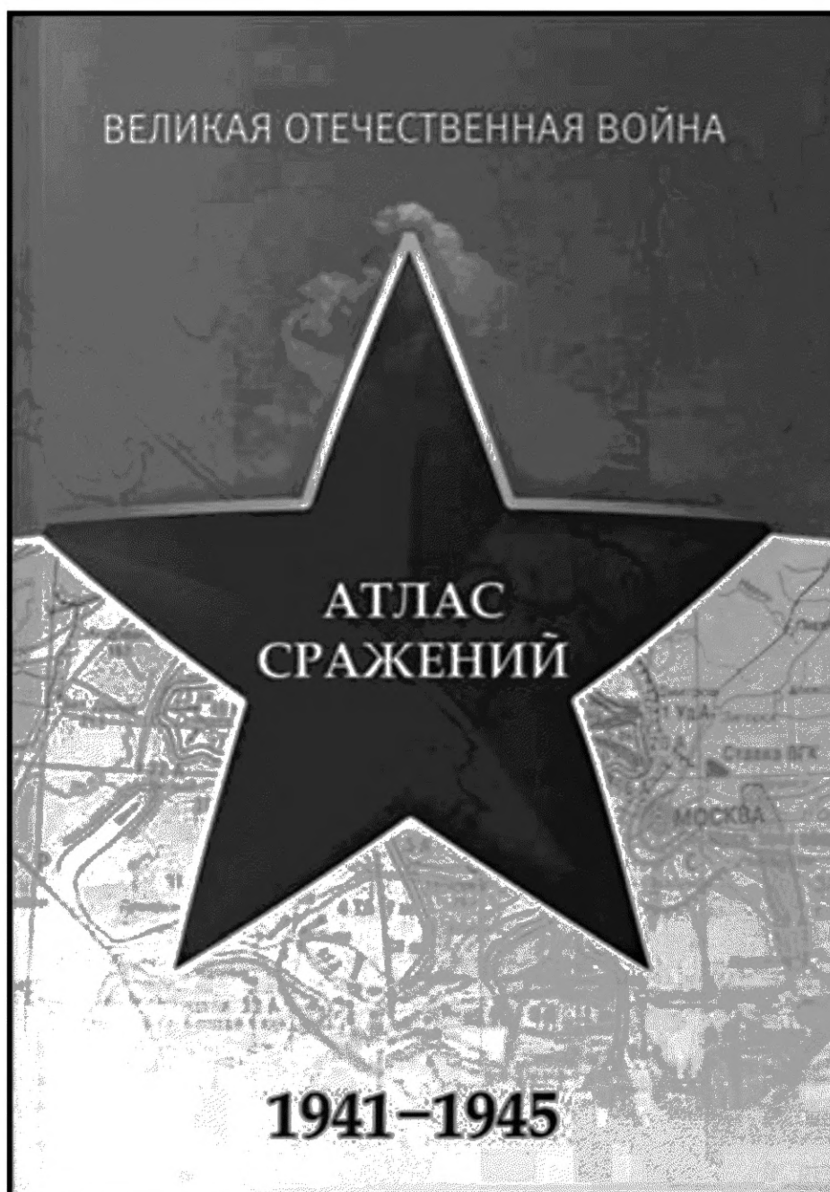
Рисунок А.1 — Образец оформления титульного листа в одностороннем атласе

А.1 Образцы оформления выходных сведений в картографических изданиях, подготавливаемых АО «Роскартография», представлены на рисунках А.1 и А.2