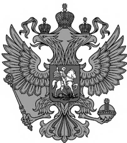
Государственный герб Российской Федерации