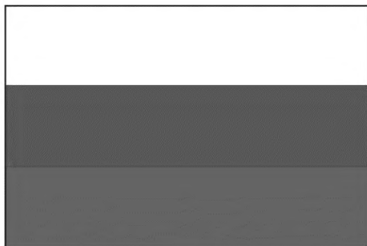
Государственный флаг Российской Федерации