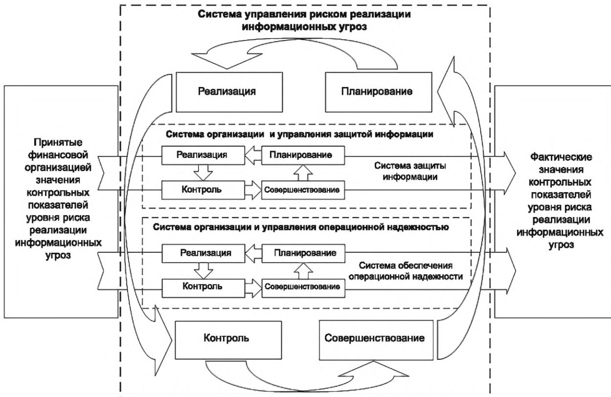
Рисунок 2 — Структура и взаимосвязи системы управления риском реализации информационных угроз финансовой организации и систем управления, определенных в рамках семейств стандартов ОН и ЗИ комплекса стандартов

7.5 Состав направлений, процессов, требований и мер реализуется в рамках системы управления риском реализации информационных угроз систем управления, определенных в рамках семейств стандартов ОН и ЗИ Комплекса стандартов, с учетом структуры и взаимосвязей, приведенных на рисунке 2.