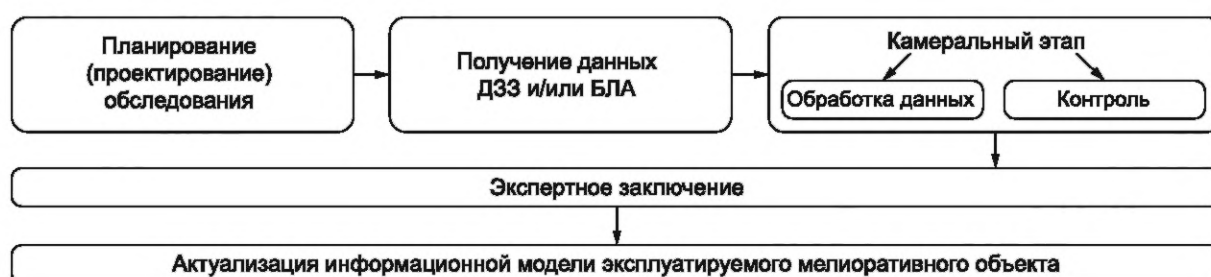
Рисунок 2 — Этапы мониторинга технического и экологического состояния ГМС или ГТС методами ДЗЗ из космоса и/или БЛА

6.2 Дополнительные требования к составу работ и содержанию этапов мониторинга технического и экологического состояния мелиоративного объекта описывают в техническом задании на обследование (см. приложение В).