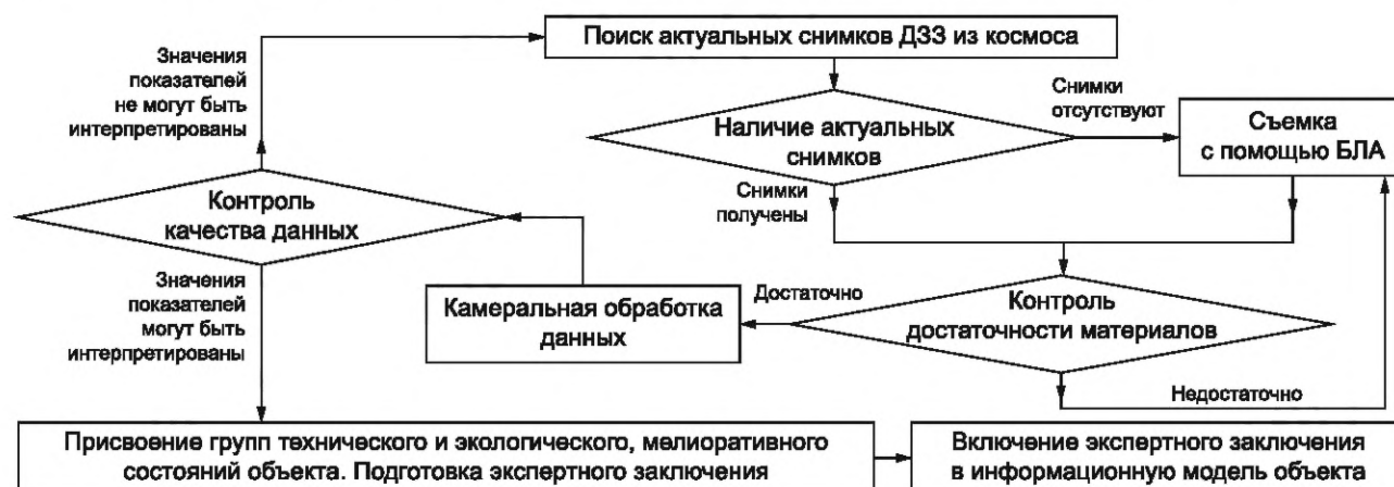
Рисунок 3 — Алгоритм оценки технического и экологического состояния мелиоративного объекта дистанционными методами

10.2 Алгоритм оценки технического и экологического состояния мелиоративного объекта с помощью данных, полученных ДЗЗ из космоса и/или БЛА, в общем виде показан на рисунке 3.