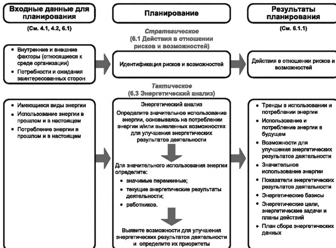
Рисунок А.2 — Процесс энергетического планирования

Принципиальная схема, предназначенная для улучшения понимания процесса энергетического планирования, показана на рисунке А.2. Рисунок А.2 не показывает подробности конкретной организации. Информация, представленная на рисунке А.2, носит пояснительный характер и не является исчерпывающей. Для данной организации или конкретных обстоятельств могут существовать другие специфичные подробности.