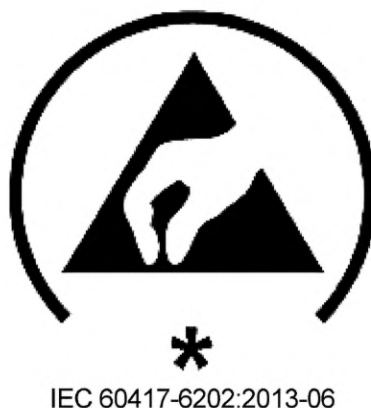
Рисунок 1 — Пример маркировки упаковки (*Код основного назначения)

Защитная антистатическая упаковка должна быть обозначена классификационным символом ЭСР, приведенным в [4] и как показано на рисунке 1, или другим способом в соответствии с контрактами заказчика, заказами на поставку, чертежами или другой документацией.