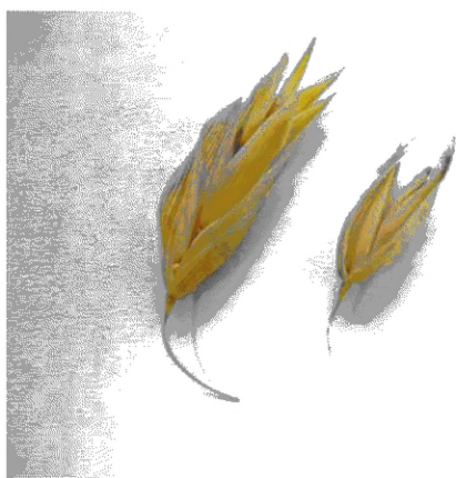
Рисунок В.2 — Колоски овса голозерного (слева) и пленчатого (справа)