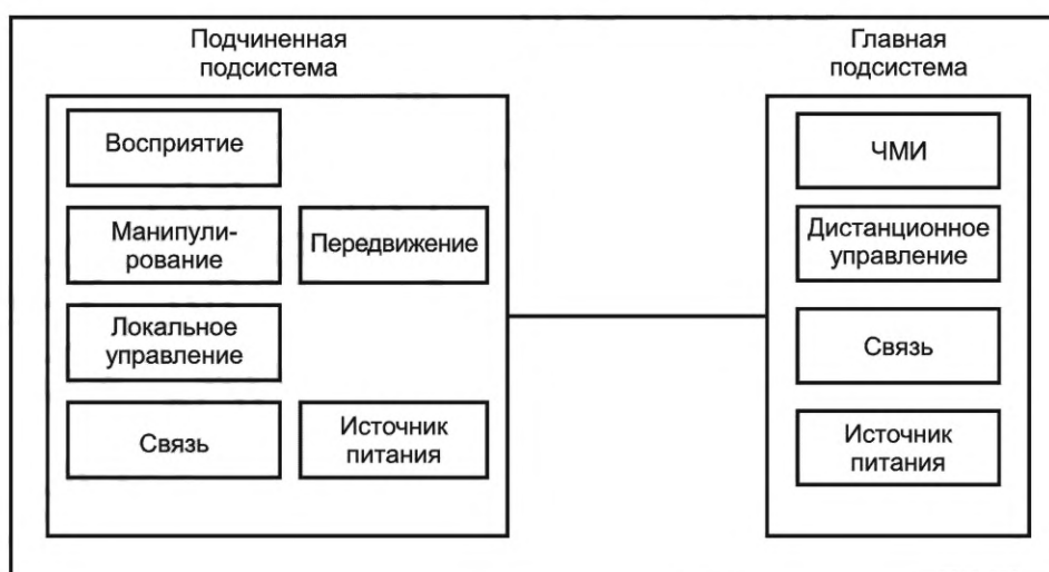
Рисунок 2 — Функции МДУС