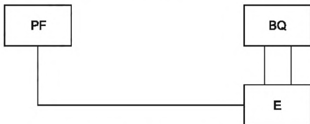
Рисунок 1 — Структурная схема измерения ослабления нежелательных резонансов для затуханий свыше 20 дБ

PF — электронно-счетный частотомер; BQ — резонатор; E — анализатор моночастотности кварцевых резонаторов с постоянным уровнем напряжения на резонаторе в измерительном мосте