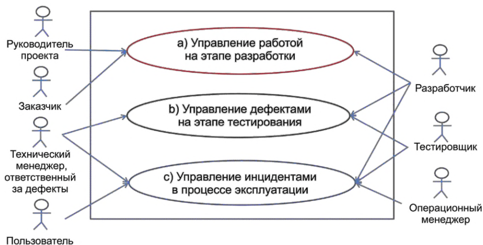
Рисунок 1 — Пример вариантов использования инструментариев

в) управление инцидентами в процессе эксплуатации: реагирование на отказы системы в процессах функционирования или сопровождения систем.