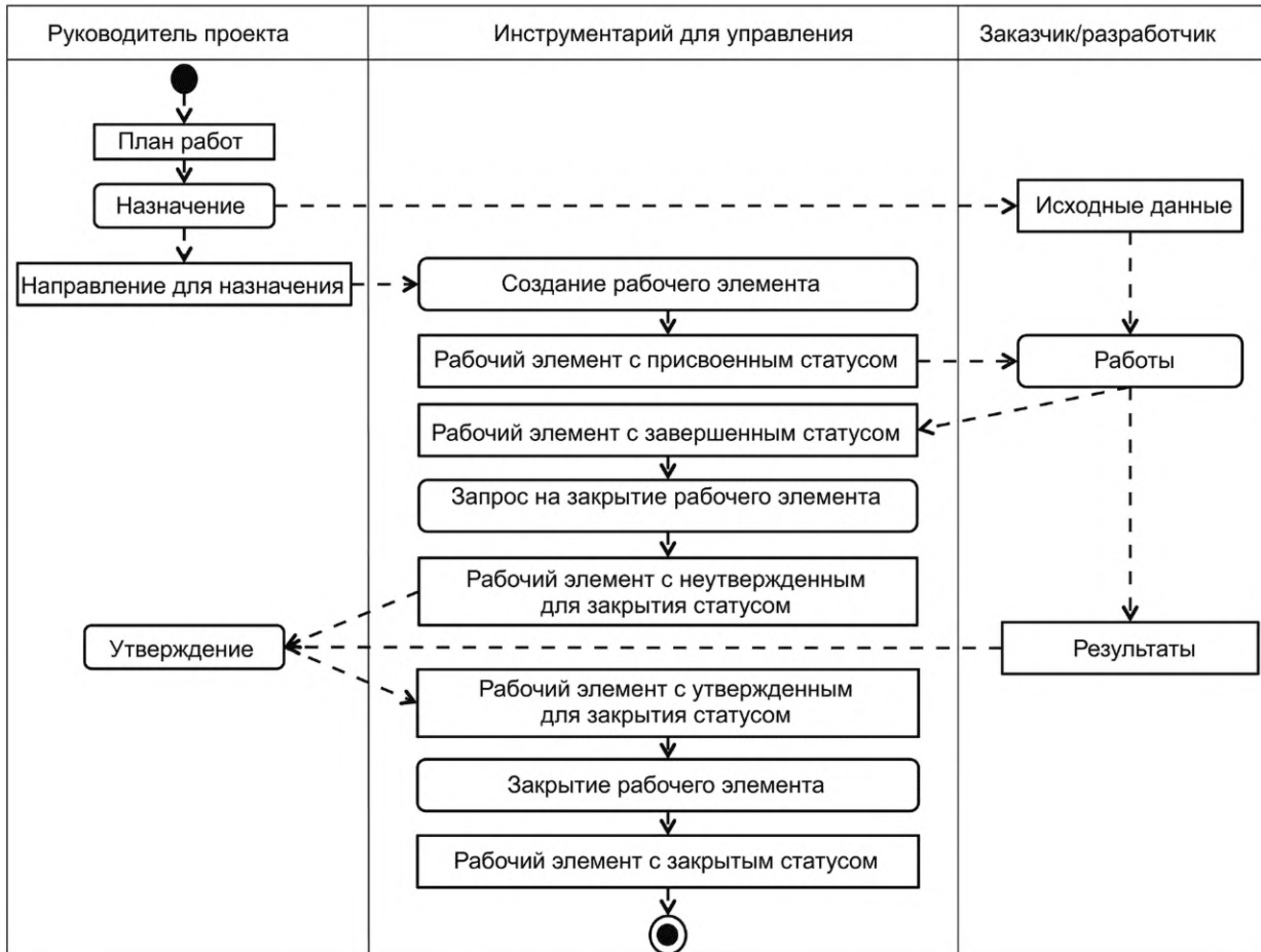
Рисунок 2 — Схема деятельности по управлению работами

В таблице 1 для различных процессов отражены основные действующие лица, исходные данные и результаты для управления работами в процессе разработки системы.