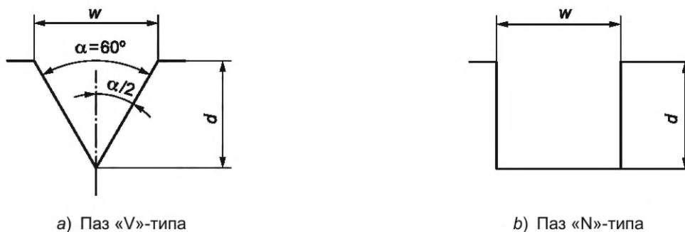
а) Паз «V»-типа

6.2.1.1 Настроечные пазы должны быть «N»-типа (перпендикулярный к поверхности паз) (см. рисунок 2); для труб, полученных электросваркой, если глубина паза составляет 0,5 мм и менее, на усмотрение изготовителя могут быть использованы пазы «V»-типа (V-образный паз) (см. рисунок 2). В случае использования паза «N»-типа его стороны должны быть параллельны, а профиль должен быть по возможности прямоугольной формы.