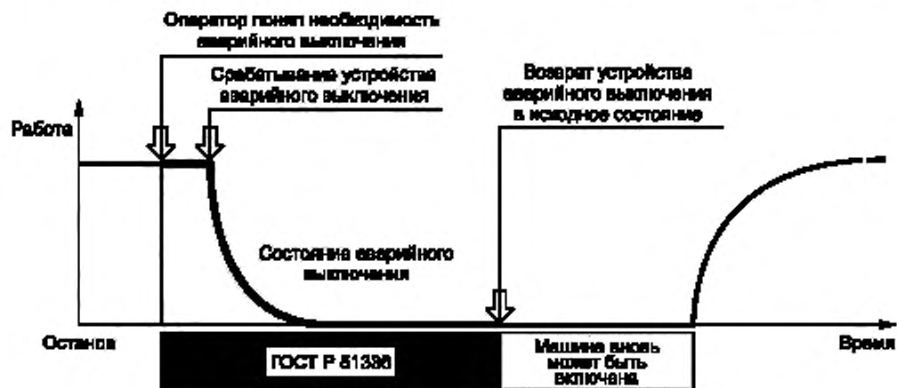
Рисунок 1 — Функциональные аспекты применения ГОСТ Р 51336

Рисунок 1 показывает принципы функционирования системы аварийного выключения.