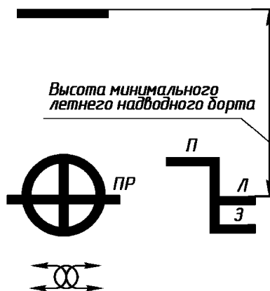
Рис. 3.1.4-2. Грузовая марка судов с минимальным надводным бортом