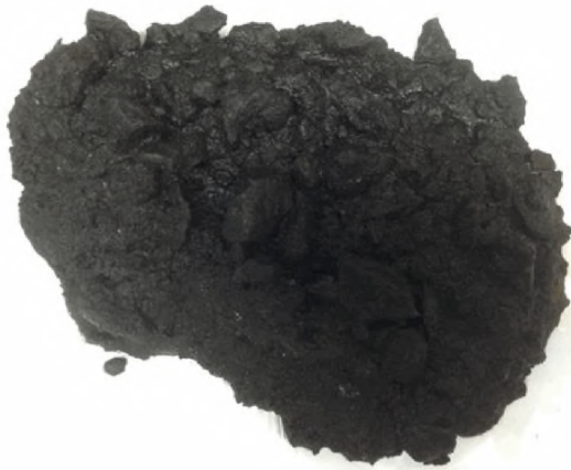
Рисунок А.2 – Смесь с битумной эмульсией пригодной для приготовления органоминеральных смесей по показателю обволакиваемости

Оценку совместимости битумной эмульсии и минерального материала органоминеральной смеси по показателю сцепления выполняют с помощью пробы, прошедшей испытания на обволакиваемость.