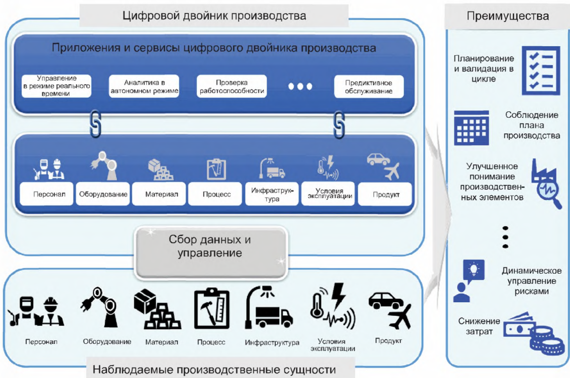
Рисунок 1 — Концепция цифровых двойников производства

Представление цифрового двойника позволяет цифровому двойнику постоянно взаимодействовать с физическими производственными элементами путем обмена эксплуатационными данными и данными об условиях окружающей среды.