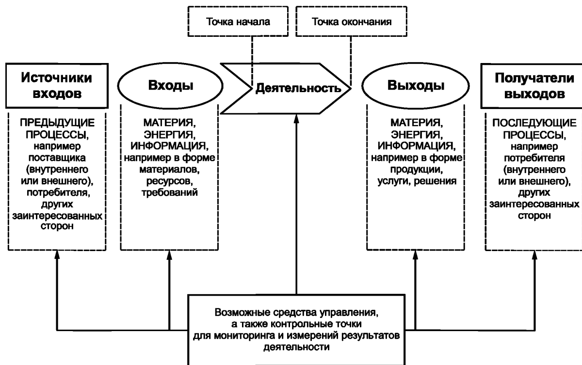
Рисунок 1 — Схематичное изображение элементов процесса

На рисунке 1 приведено схематичное изображение любого процесса и проиллюстрирована взаимосвязь элементов процесса. Контрольные точки мониторинга и измерения, необходимые для управления, являются специфическими для каждого процесса и будут варьироваться в зависимости от соответствующих рисков.