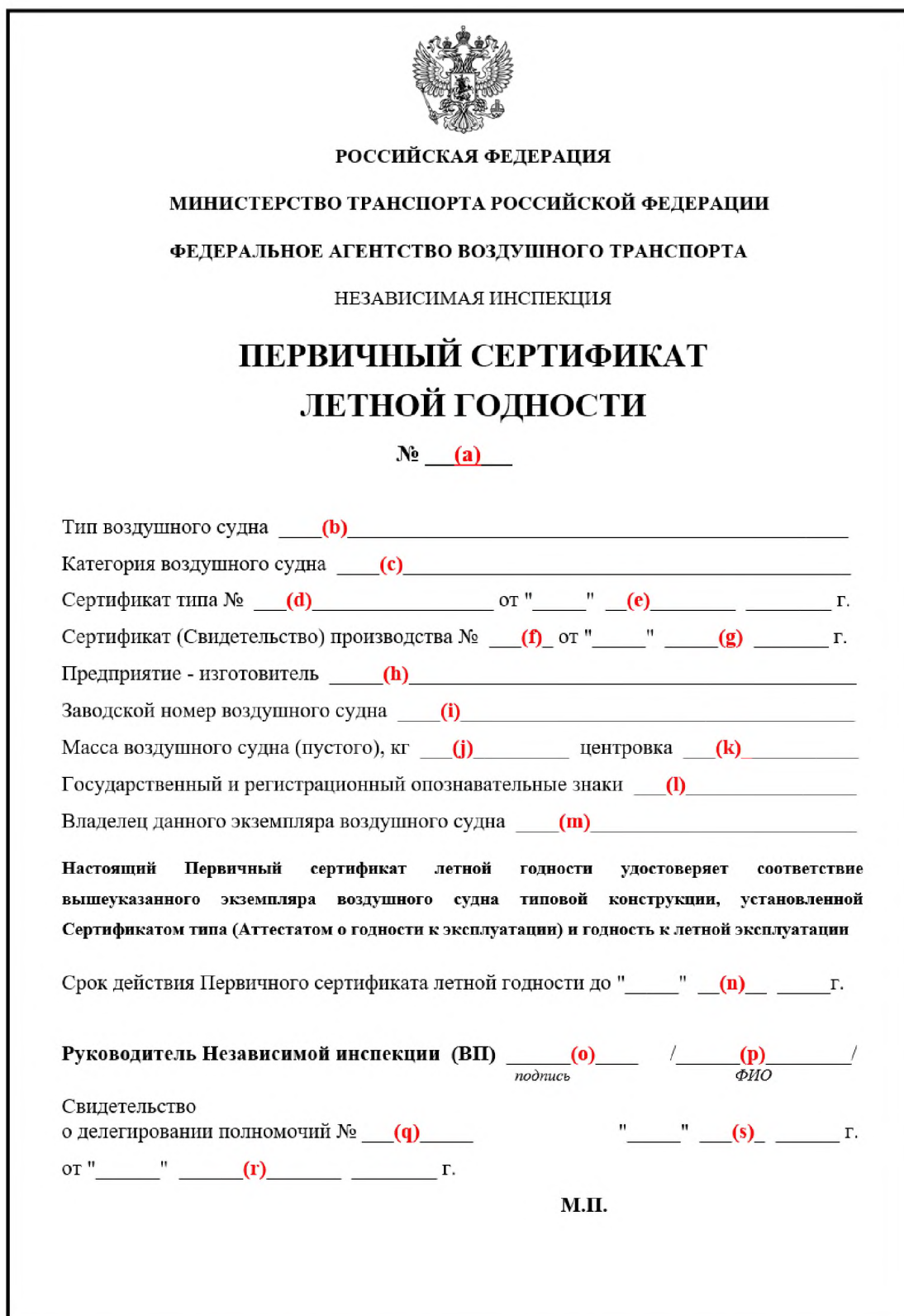
Рис. 1-9. Форма MP-21.001-08 – Первичный сертификат лётной годности