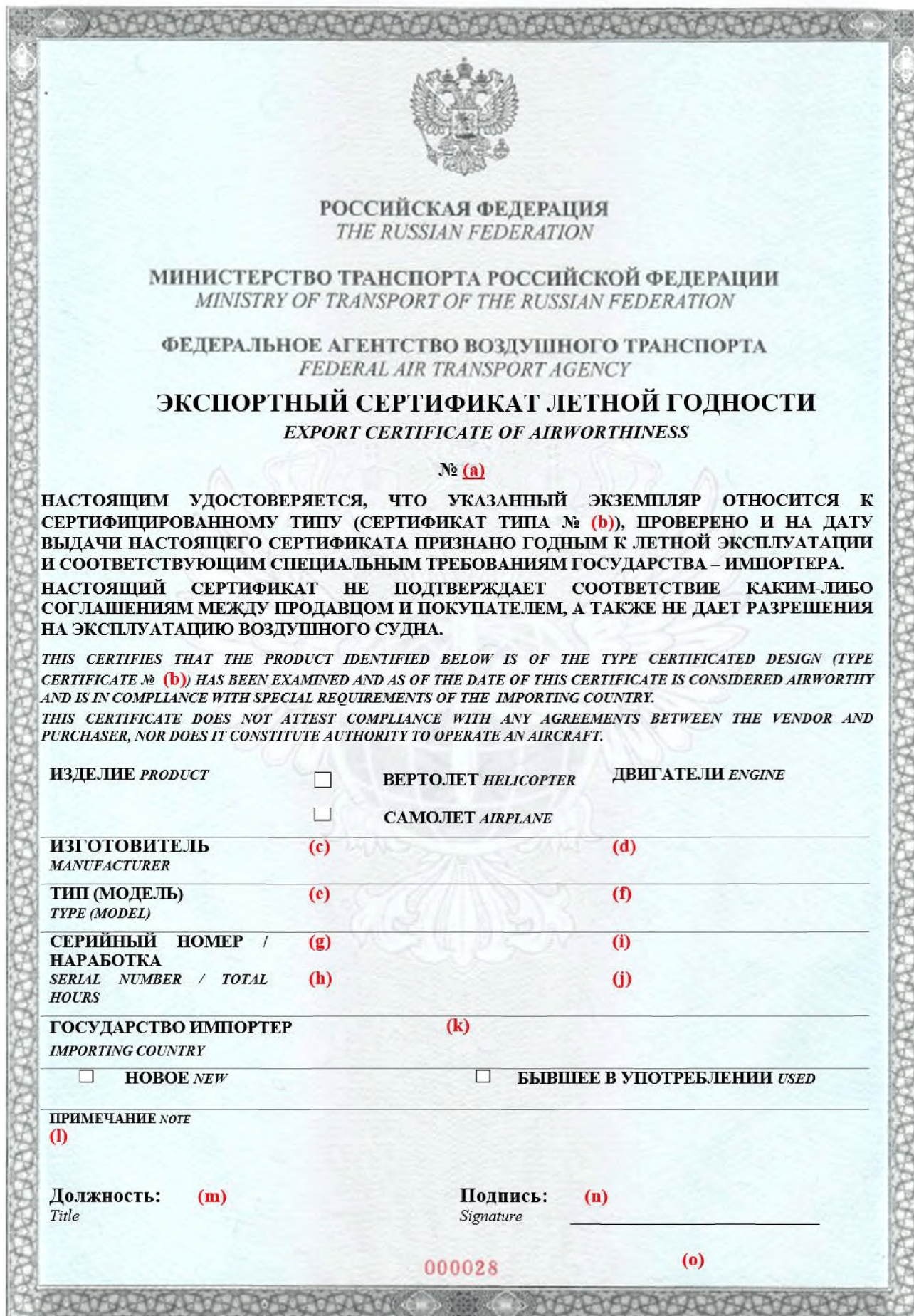
Рис. 1-10. Форма MP-21.001-09 (E-01) – Экспортный сертификат лётной годности