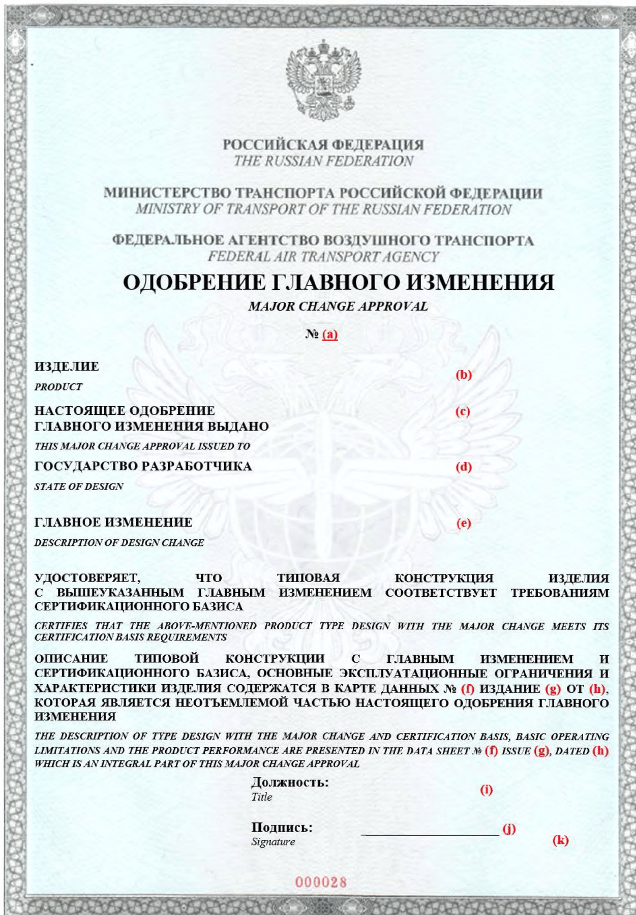
Рис. 1-4. Форма MP-21.001-04 – Одобрение главного изменения