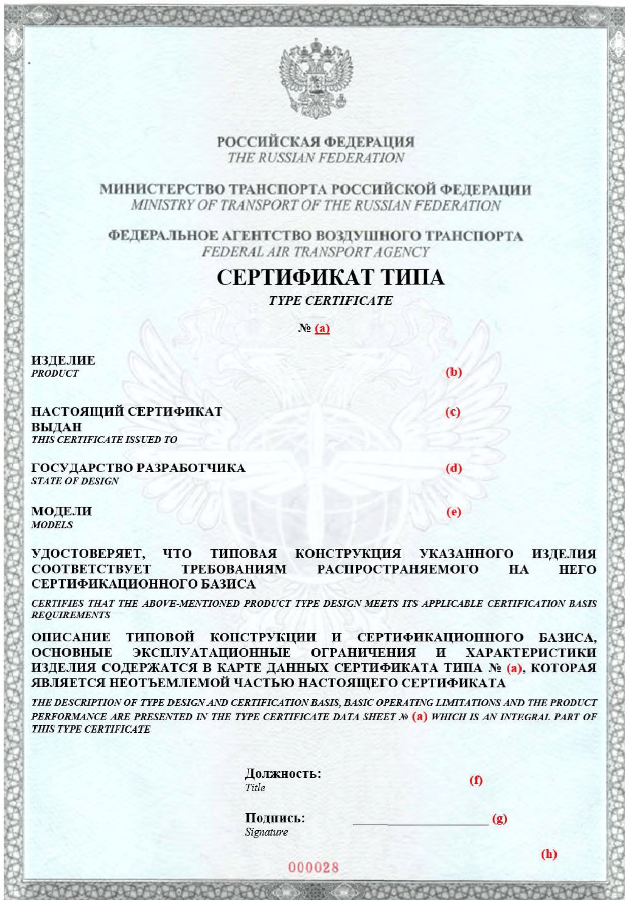
Рис. 1-1. Форма MP-21.001-01 – Сертификат типа