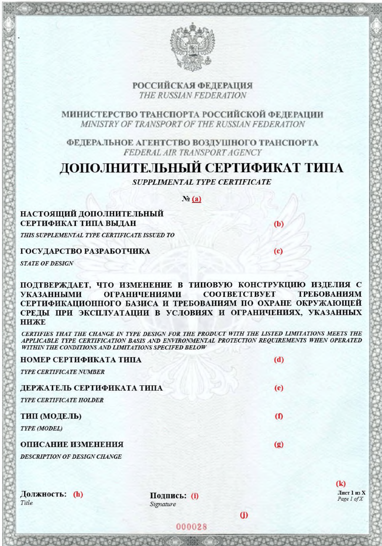
Рис. 1-5. Форма MP-21.001-05 – Дополнительный сертификат типа