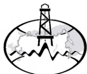
Министерство природных ресурсов и экологии Российской Федерации