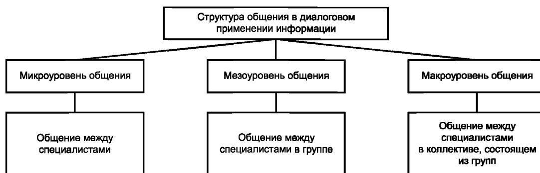
Рисунок 2 — Структура общения в диалоговом применении информации

Общение с диалоговым применением информации с его структурированным проведением по уровням сложности может быть выполнено с учетом масштаба времени, сложности сети взаимосвязей отдельных специалистов и их групп, масштаба деятельности, нормативных факторов.