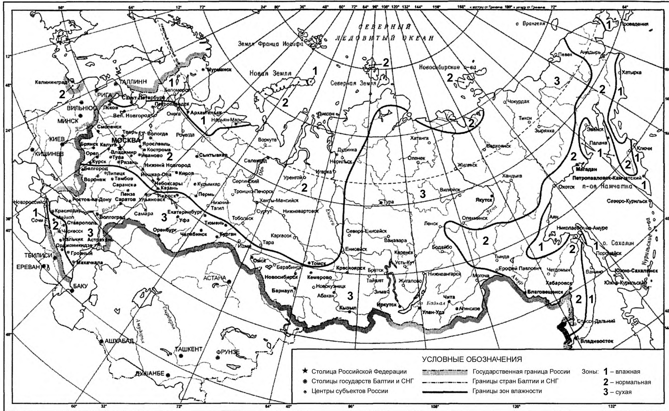
Карта Российской Федерации с зонами по влажности