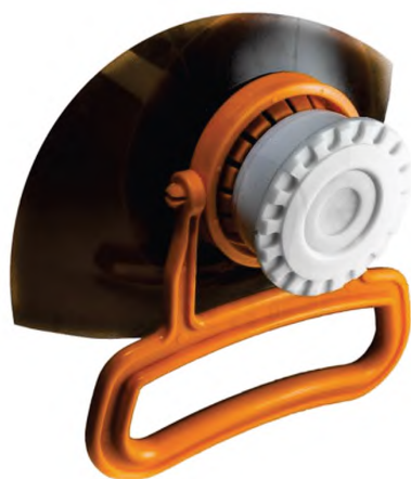
Рисунок А.4 — Съемные ручки для кег (бутылей)