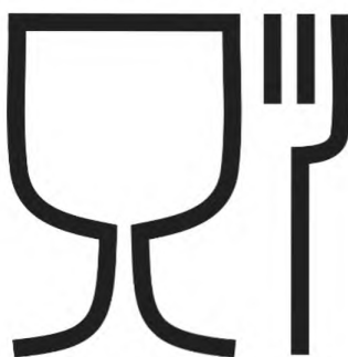
Рисунок Б.2.1 — Символ для упаковки, предназначенной для контакта с пищевой продукцией, допускается наносить без рамки или в рамке (круглой, квадратной и др.)

Б.2 Символы, наносимые на бутылку и/или сопроводительную документацию