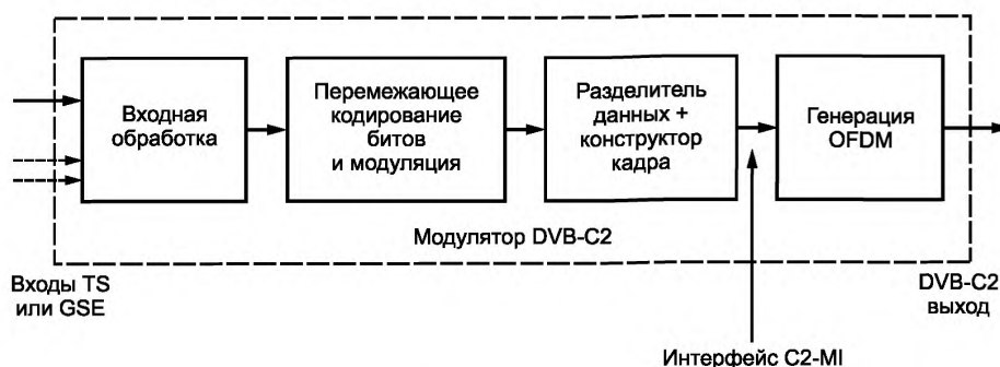
Рисунок 1 — Положение интерфейса C2-MI внутри структурной схемы модулятора DVB-C2

Концепция интерфейса модулятора DVB-C2 определяет интерфейс на выходе разделителя данных и конструктора кадра модулятора DVB-C2 и отображает эту структуру данных на структуру временного мультиплексирования (TDM). Положение интерфейса C2-MI внутри структурной схемы модулятора DVB-C2 показано на рисунке 1.