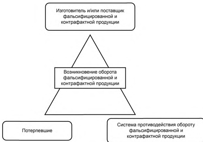
Рисунок 2 — Схема взаимоотношений участников противоправных действий, потерпевших от противоправных действий, системы противодействия обороту фальсифицированной и контрафактной продукции

4.2.4 Следует учитывать, что правонарушение, связанное с оборотом фальсифицированной и контрафактной продукции, происходит в тех случаях, когда обладающий мотивацией на совершение правонарушения изготовитель и/или поставщик фальсифицированной и контрафактной продукции и потерпевшая сторона (потребитель фальсифицированной и контрафактной продукции) одновременно присутствуют на рынке, и при этом система противодействия обороту фальсифицированной и контрафактной продукции не обладает необходимой эффективностью, чтобы предотвратить производство, поставку и передачу потребителю такой продукции.