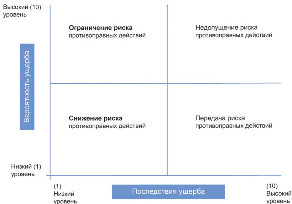
Рисунок 3 — Управление риском, связанным с оборотом фальсифицированной и контрафактной продукции