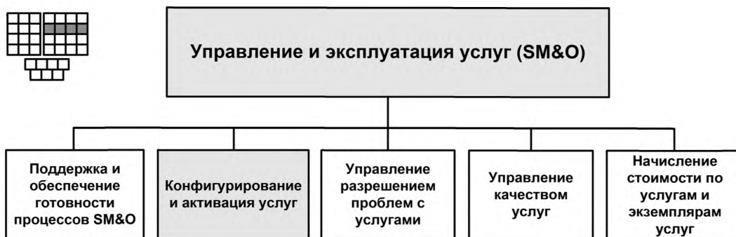
Рисунок 1 — Декомпозиция группы процессов SM&amp;O на элементы процессов уровня 2