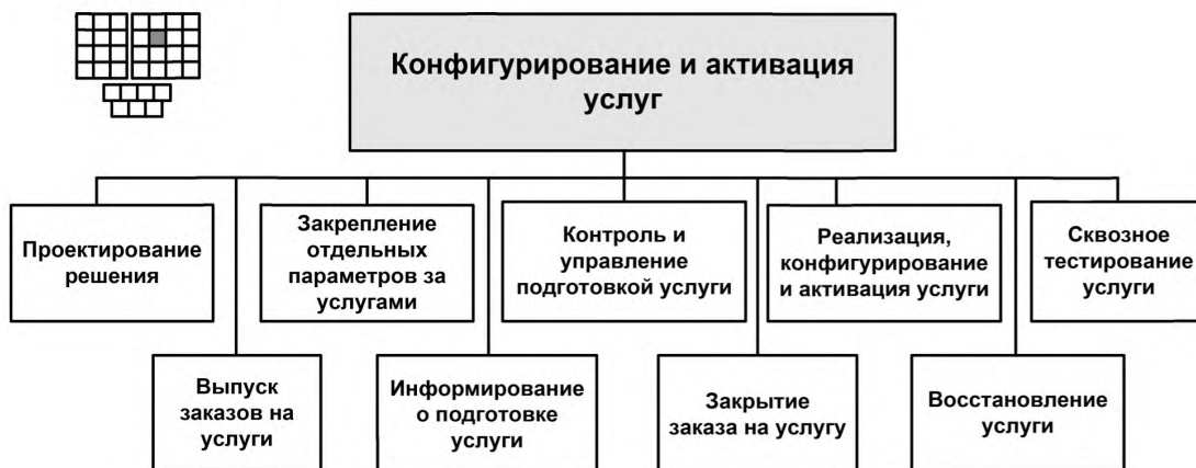
Рисунок 3 — Декомпозиция процесса 1.1.2.2 «Конфигурирование и активация услуг» на элементы процессов уровня 3

6.1 Структура процесса 1.1.2.2 «Конфигурирование и активация услуг» и соответствующие элементы процессов уровня 3 представлены на рисунке 3.