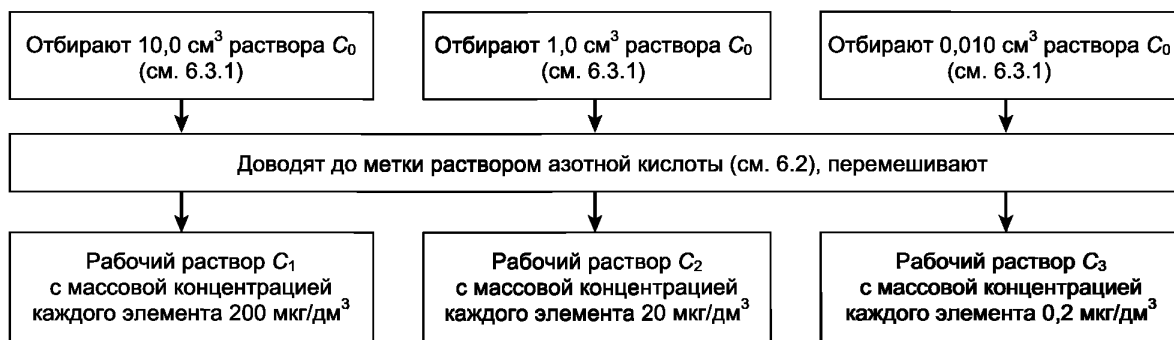
Рисунок 1 — Приготовление рабочих растворов C_1, C_2, C_3

Рабочие растворы C_1, C_2, C_3 готовят в мерных колбах вместимостью 50 \text{ см}^3 в соответствии с рисунком 1.