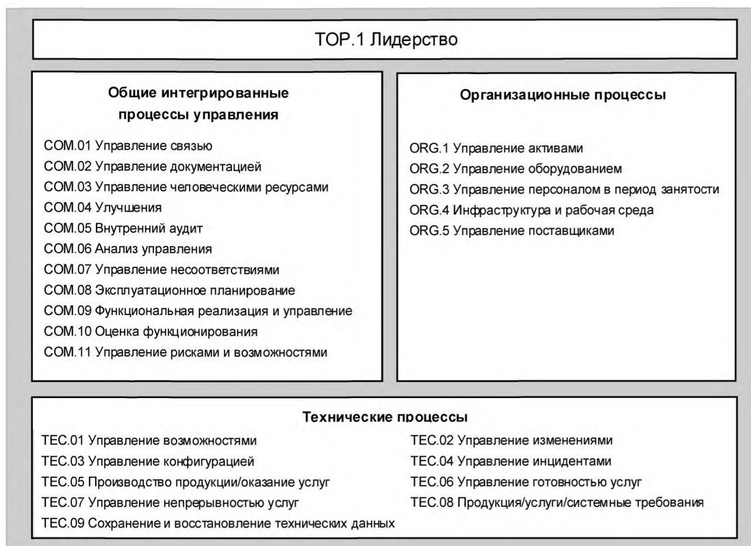
Рисунок 2 — Процессы в ЭМП