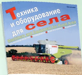
Комбайн LEXION теперь производства ООО «КЛААС» г. Краснодар