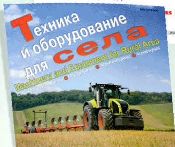
Аренда трактора AXION. Убедитесь в его производительности при минимальном расходе топлива. • 2 или 3 года аренды • Нарезка: 1300 м 2 или 2000 м 2 в год • Возможность вывоза моты травы задела