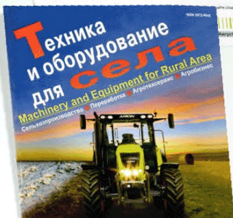
ARION 640 C / ARION 430. Один компактный на весь период работ. • Полный набор опций и модификаций • Простое управление и обслуживание • МАРТИ ОБЪЕДИНЕН • Удлинитель 155 п.с. на АРИБЕАД С и 115 п.с. на АРИБЕАД СЕ R130 Все от дилера АРИБЕАД С и АРИБЕАД СЕ индивидуально адаптированы для работы в России ООО «КЛААС» Москва, г. Подольск, г. Псков www.klas.ru

Ежемесячный полноцветный научно-производственный и информационно-аналитический журнал «Техника и оборудование для села», учредителем и издателем которого является ФГБНУ «Росинформагротех», выпускается с 1997 г. при поддержке Минсельхоза России и Россельхозакадемии. За это время журнал стал одним из ведущих изданий в отрасли и как качественное и общественно значимое периодическое средство массовой информации в 2008, 2009 и 2011 гг. удостоен знака отличия «Золотой фонд прессы». В редакционный совет журнала входят 10 академиков Россельхозакадемии.