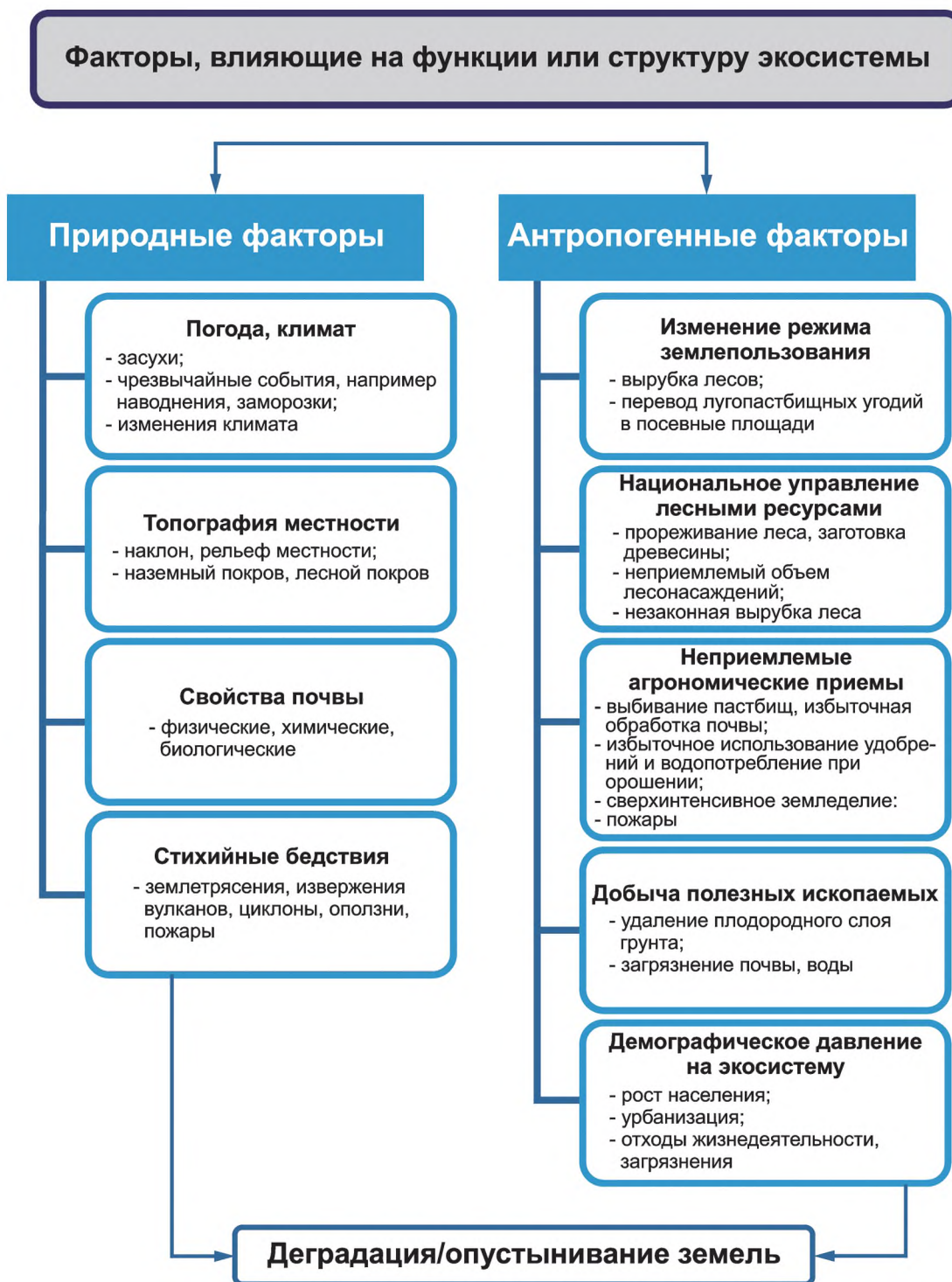
Рисунок 2 — Примеры основных природных и антропогенных факторов, которые могут приводить к деградации и опустыниванию земель