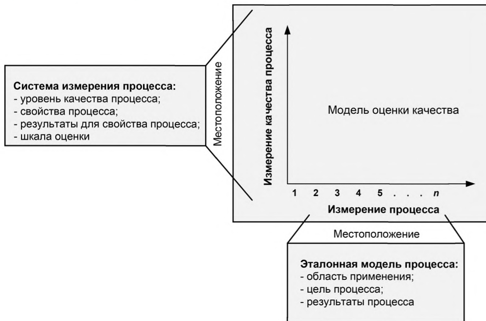
Рисунок 2 — Взаимоотношения в рамках модели оценки процесса

Оценку процесса проводят путем сравнения результатов выполнения данного процесса (процессов) в организационном контексте с ожидаемыми результатами выполнения, заданными в модели оценки процесса. В модели оценки процесса совмещается базовый состав описаний процесса одной или более эталонных моделей процесса с конструкциями и элементами, описанными в выбранной системе измерения процесса. На рисунке 2 приведены отношения между моделью оценки процесса, соответствующей эталонной моделью процесса и системой измерения процесса. Двухмерная модель, изображенная на рисунке 2, состоит из состава процессов, созданного с учетом их целей и результатов, и системы измерения процесса, которая содержит состав свойств процесса, относящихся к нужным качественным характеристикам процесса. Свойства могут применяться ко всем процессам. Свойства могут быть сгруппированы в уровни качества процесса. Эти уровни могут быть использованы для описания процесса. В результат оценки входит состав профилей процесса и, если необходимо, система оценок уровня качества для каждого из процессов.