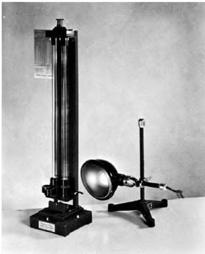
Рисунок А1.1 — Колориметр Сейболта и лампа искусственного дневного света

Для испытания жидкостей используют трубку из боросиликатного или равноценного ему по цветовым характеристикам стекла внутренним диаметром не менее 16,5 мм и не более 17,5 мм и наружным диаметром не менее 21,25 мм и не более 22,75 мм. Основание трубки закрывают чистым плоским диском из оптического стекла толщиной 6,25 мм без полос и царапин. Длина трубки от верхней поверхности плоского диска до верхнего края трубки должна быть от 508 до 510 мм. Устанавливают трубку и диск в соответствующем металлическом кольце, оснащённом сливным краном для обеспечения контролируемого слива продукта из трубки (см. рисунок А1.1). Конструкция кольца должна обеспечивать удаление стеклянного диска для очистки. Трубка должна быть градуирована с ценой деления 1/8 дюйма (3,2 мм). Линии целых дюймов гравированы вокруг всей трубки, и их последовательно нумеруют, начиная с 2 дюймов (50 мм).