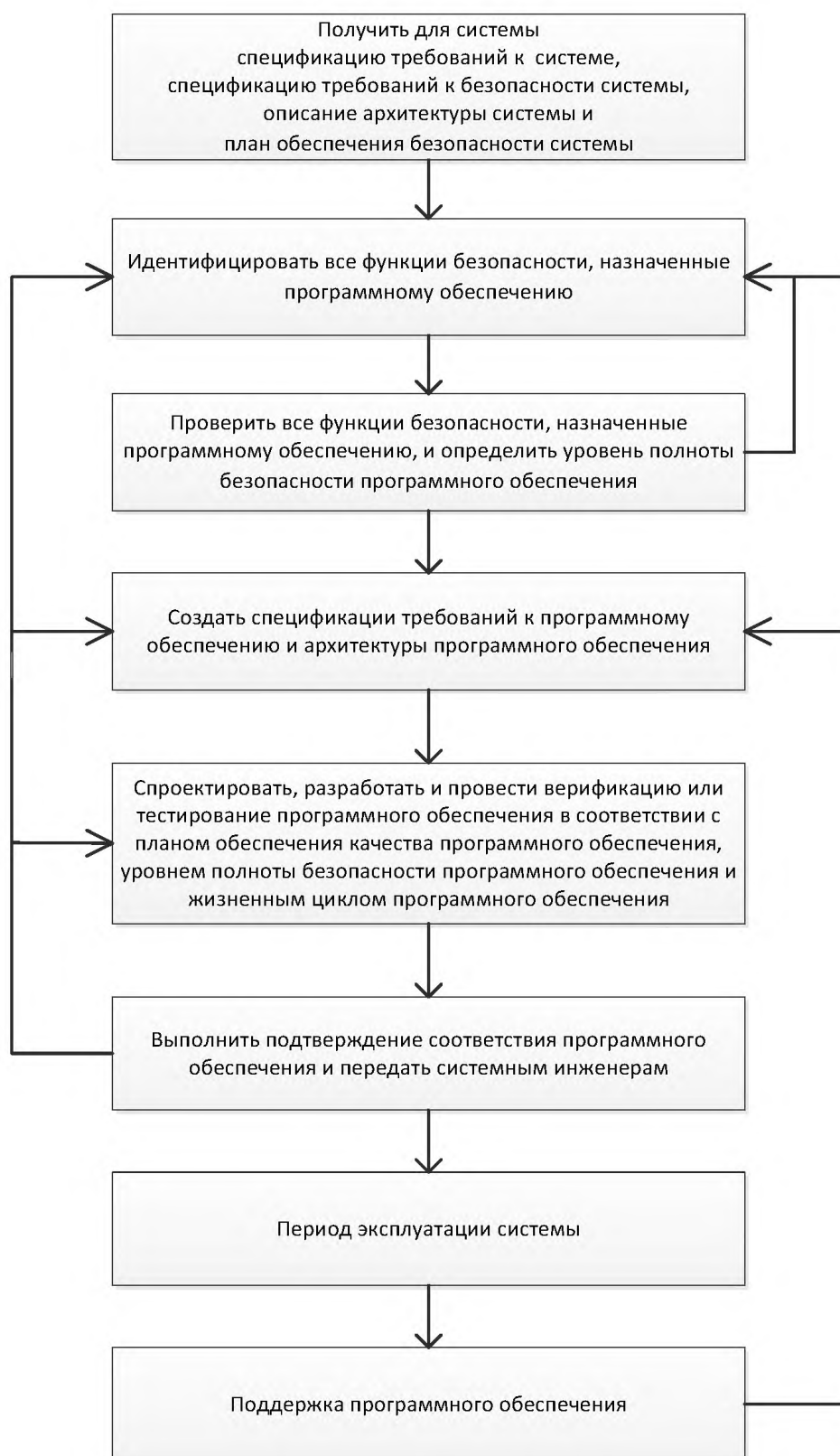
Рисунок 1 — Маршрутная карта программного обеспечения