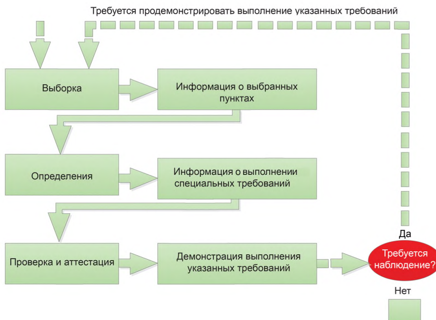
Рисунок 2 — Функциональный подход к оценке соответствия 1)

Каждый этап включает в себя действия, описанные ниже, при этом выход из одного этапа будет являться входом во второй этап.