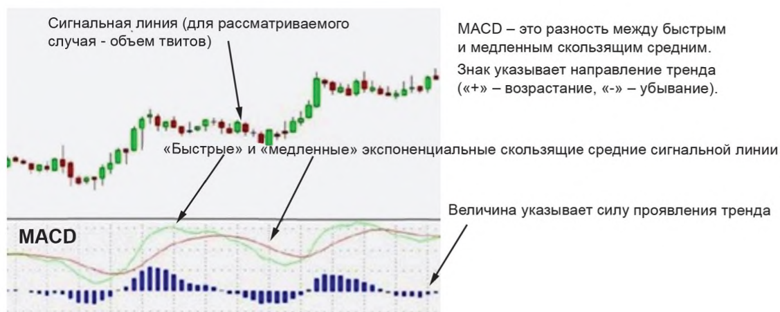
Рисунок 1 — Графическое представление MACD

Для определения тренда используют индикатор MACD (Moving Average Convergence/Divergence — схождение/расхождение скользящих средних) для нормированных временных рядов данных (см. рисунок 1).