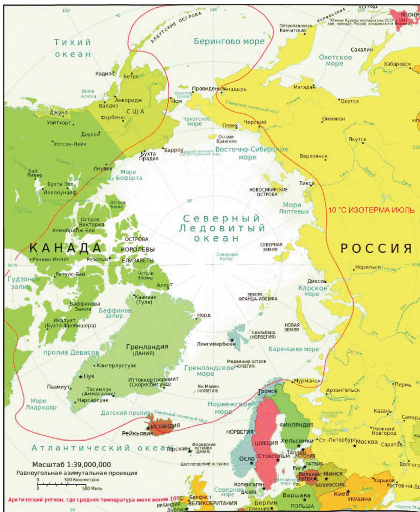
Рисунок А.1 — Арктический регион

Арктика — территории, примыкающие к Северному полюсу и включающие окраины материков Евразии и Северной Америки, почти весь Северный Ледовитый океан с островами (кроме прибрежных островов Норвегии), а также прилегающие части Атлантического и Тихого океанов. Площадь Арктики составляет около 27 млн км 2 . Если Арктику ограничить с юга Северным полярным кругом (66° 33' с. ш.), в этом случае ее площадь составит 21 млн км 2 . Арктика поделена на пять секторов ответственности между США, Россией, Норвегией, Канадой и Данией (см. рисунок А.1). Точная граница Арктики не определена.