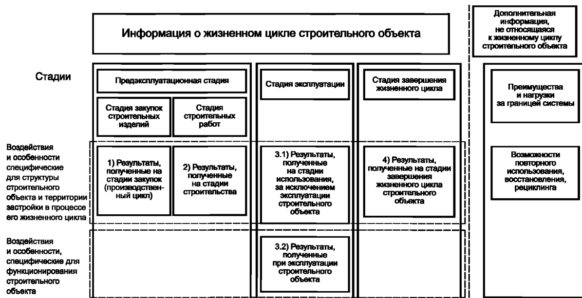
Рисунок 2 — Представление результатов определения оценки в соответствии со стадиями жизненного цикла и информационными группами

- результаты, полученные на стадиях планирования и закупок до начала стадии строительства (см. рисунок 2, блок 1);