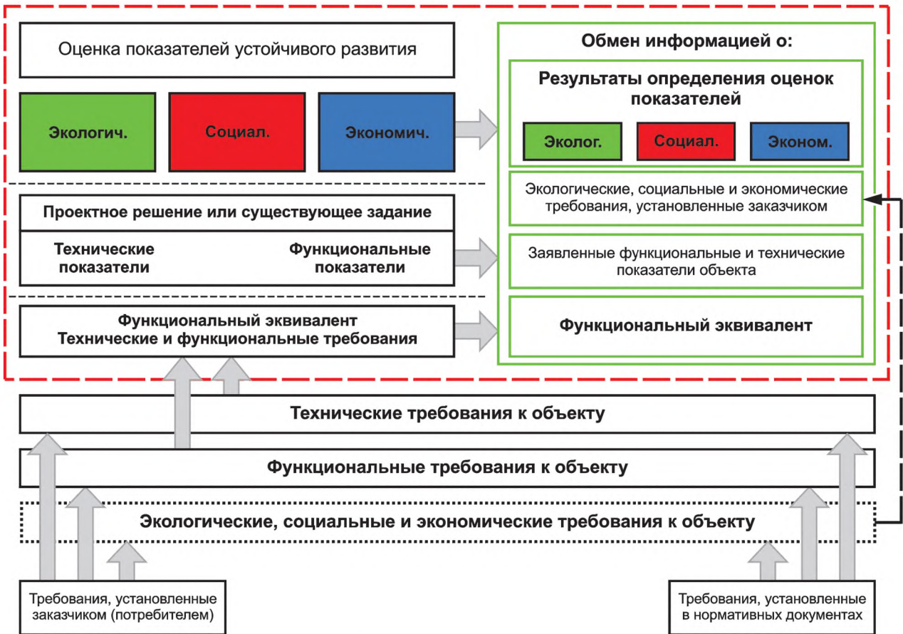
Рисунок 1 — Структура определения оценки показателей устойчивого развития строительного объекта